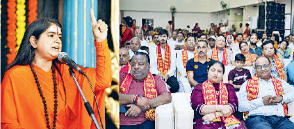
कैथल। साखी गरिमा भारत प्रारंभ करने हुए।

दिव्य ज्योति जाग्रति संस्थान की ओर से भजन संघ्या