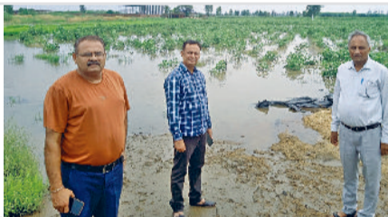
उचाना। बारिश से हनु कपास की फसल के नुकसान का आंकलन करने पहुंची कृषि विभाग की टीम।