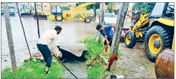
कैथल। बरसात के बीच नालों को खोलते कर्मचारी।