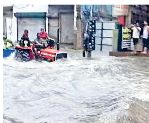
जींद। अपोलो चौक पर जलभराव के बीच से निकलता ट्रैक्टर।