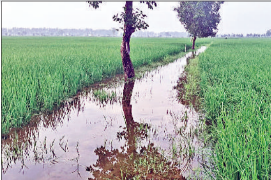
जीट। बारिश के पानी से जलमग्न हुए खेत व नरवाना के घनना भगत चौक पर बरसात के चलते हुआ जलभराव।

मानसून की सक्रियता के चलते रविवार को दिन का आगाज आकाश में मंडरते बादलों हलकी फुहार के साथ हुआ। नरवाना में 60 एमएम, उचाना में 30 एमएम, जुलाना में दो एमएम, पिल्लूखेड़ा में सात एमएम बारिश दर्ज की गई। जबकि अन्य स्थानों पर हल्की बूझबांदी हुई। आकाश में बादलों को जमावड़ा दिनभर लगा रहा और बारिश की संभावना बनी रही। तापमान में तीन डिग्री की गिरावट दर्ज की गई।