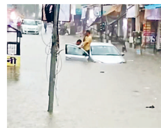
जींद ओल्ड कोर्ट रोड पर भारी जलभराव में डूबी कार।