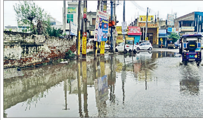
जींद। शहर में सड़क किनारे जमा बरसाती पानी।

लघु सचिवालय में बाढ़ नियंत्रण कक्ष स्थापित बारिश के चलते अनावश्यक घर से न निकलें