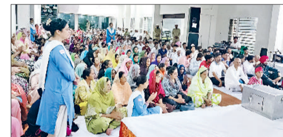
गुहला चौका। संत समागम में उपस्थित श्रद्धालु।

दिखाई नहीं दे रहे हैं। यहां से आने-जाने वाले वाहन चालकों को सबसे अधिक परेशानी का सामना करना पड़ रहा है। उपमंडल कार्यालय, पुलिस थाना के पास बने सर्विस रोड पर भी जलभराव है।