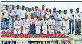
पूंडरी। खिलाड़ियों के स्कूल स्टॉफ व पंचायत सदस्य।