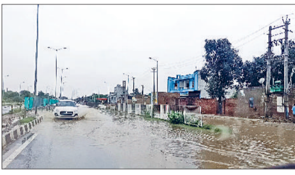
उचाना। बड़ौदा में नेशनल हाइवे पर जलभराव से गुजरते हुए वाहन।

उचाना। रविवार को हुई तेज बारिश के बाद शहर के रेलवे रोड, लितानी रोड, बैंक कॉम्प्लेक्स सहित कई बाजारों में जलभराव होने से परेशानी का सामना करना पड़ा। कुछ दिनों से बारिश हो रही है। बारिश होने से गर्मी से लोगों को राहत मिल रही है। बारिश से धान की फसल को फायदा हुआ है तो कपास की फसल खराब होने का डर किसानों को बन रहा है। खेतों में पानी बारिश के बाद भरा हुआ है। ऐसे में कपास की फसल को नुकसान होने का डर किसानों को है। आने वाले दिनों में भी बारिश होने की संभावना जताई जा रही है। बड़ौदा के ओवरब्रिज के दोनों तरफ सर्विस रोड पर जलभराव होने से सर्विस रोड से होकर आने-जाने वालों को परेशानी का सामना करना पड़ा। यहां पर सड़क में गहरे गड्ढे बनने के बाद जलभराव होने से