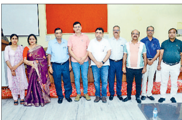
जीट। हिंदू कन्या महाविद्यालय की चुनी गई कार्यकारिणी।

हिंदू कन्या महाविद्यालय में रविवार को प्रबंधक समिति के चार मुख्य पदाधिकारियों के निर्वाचन की प्रक्रिया संपन्न हुई। वर्ष 2022 में गठित प्रबंधक समिति का कार्यकाल तीन वर्ष पूर्ण होने पर वर्ष 2025 में पुनः निर्वाचन कराना