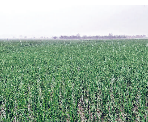
जींद। बारिश के पानी से जलमग्न हुए खेत।

हरियाणा पंजाब सीमा पर स्थित गांव सिहाली, रत्ता खेड़ा, मंझेड़ी व मैंगड़ा के पास घग्गर नदी का पानी खेतों से होकर बहा रहा है, जिसके चलते लगभग आधा दर्जन गांवों में धान की फसल के साथ साथ पशुओं का चारा, सब्जियां बर्बाद होने के कगार पर पहुंच गई है। घग्गर का पानी खेतों में घुसने के बावजूद किसी भी प्रशासनिक अधिकारी ने इन गांवों में जाकर किसानों की सुध नहीं ली, जिससे गुस्साएं किसानों ने सरकार के खिलाफ रोष प्रदर्शन किया।