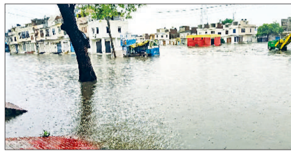
चीका। अनाज मंडी में हिलोरे मारता बरसाती पानी।

सभी विभागों को एक साथ मिलकर काम करने और यह सुनिश्चित करने के लिए कहा गया है कि पानी की निकासी सुचारु रूप से हो। उन्होंने आमजन से भी सहयोग बनाए रखने की अपील की है।